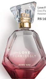
Love Fearlessly™ Deo Parfum, 50 ml Floral Amadeirado