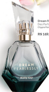
Dream Fearlessly™ Deo Parfum, 50 ml Chypre Floral