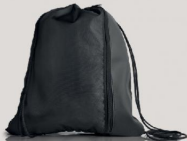
Bolsa Esportiva (41 x 35 cm)