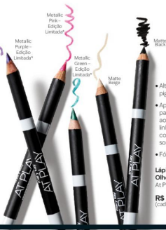
Metallic Pink - Edição Limitada*