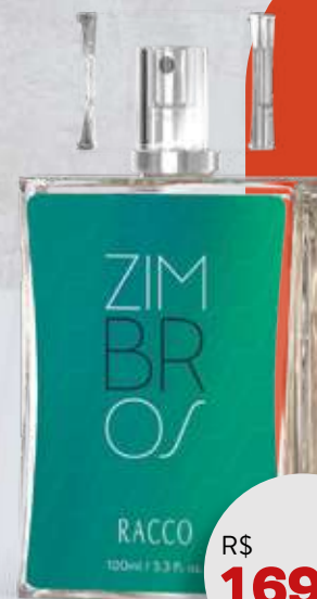
DEO COLÔNIA MASCULINA ZIMBROS RACCO 100ml 211