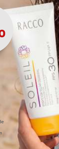
PROTECTOR SOLAR CORPORAL FPS 30 SOLEIL RACCO 100g 3057