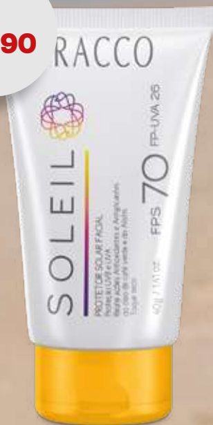
PROTECTOR SOLAR FACIAL FPS 70 SOLEIL RACCO 40g 3054