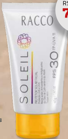
PROTECTOR SOLAR FACIAL FPS 30 SOLEIL RACCO 40g 3059