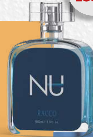
DEO COLÔNIA MASCULINA NU RACCO 100ml 450