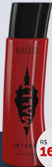
DEO COLÔNIA MASCULINA MALLE INTENSE RACCO 100ml 148