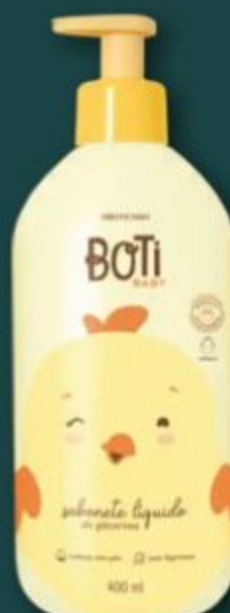
52025 BOTI BABY SABONETE LÍQUIDO DE GLICERINA, 400 ml

Promoção válida para o ciclo 06/2025 incluindo sua captação estendida. Para ter direito aos descontos os itens deverão constar necessariamente no mesmo pedido. Esta promoção valerá para as unidades que o revendedor comprar, dentro do ciclo, de acordo com a disponibilidade de estoque do Espaço do Revendedor. *Lucro se aplica a item selecionado.