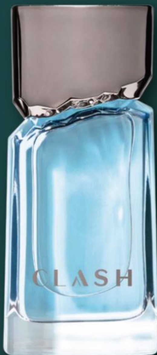
50677 CLASH DESODORANTE COLÔNIA, 100 ml