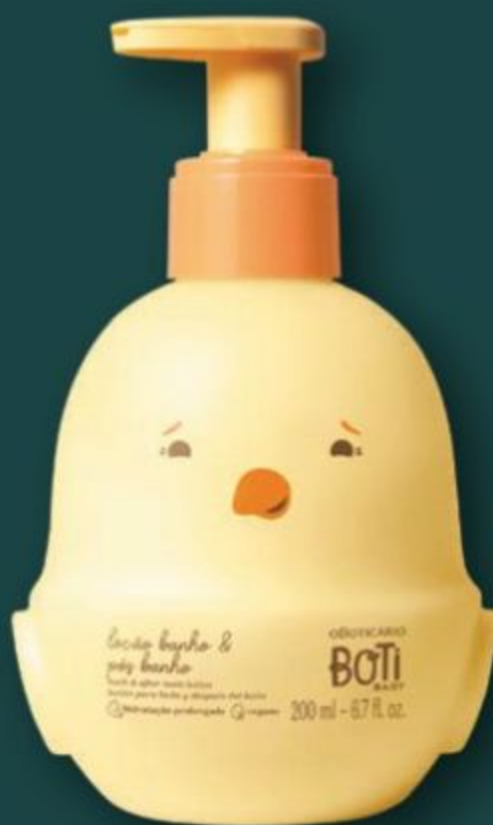
52022 BOTI BABY LOÇÃO BANHO E PÓS BANHO, 200 ml