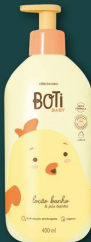
52023 BOTI BABY LOÇÃO BANHO E PÓS BANHO, 400 ml