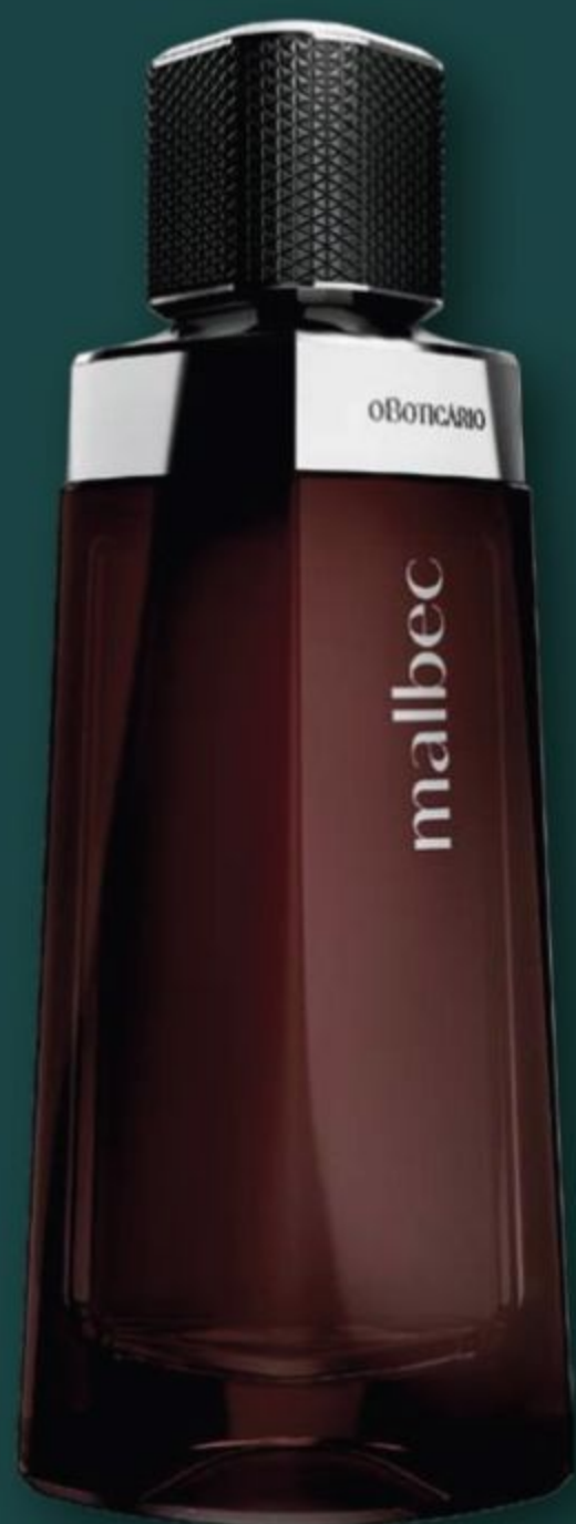
84387 MALBEC DESODORANTE COLÔNIA, 100 ml