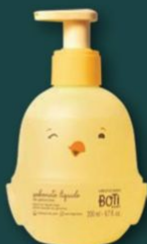
51801 BOTI BABY SABONETE LÍQUIDO DE GLICERINA, 200 ml