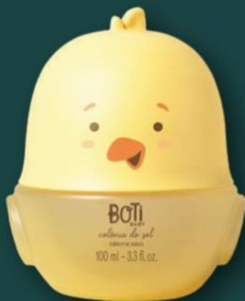
51802 BOTI BABY COLÔNIA DO SOL, 100 ml

BOTI BABY É A MELHOR MARCA DE PRODUTOS INFANTIS PARA PRESENTEAR