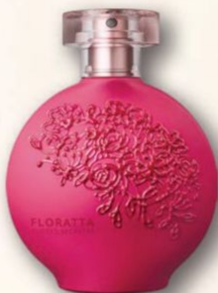
48136 FLORATTA FLORES SECRETAS DESODORANTE COLÔNIA, 75 ml