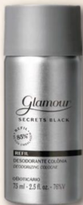
84260 REFIL GLAMOUR SECRETS BLACK DESODORANTE COLÔNIA, 75 ml

Confira mais Perfumarias Regulares e Refis participantes no APP ou Portal do Revendedor