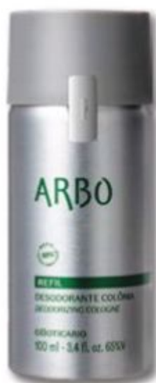
81054 REFIL - ARBO DESODORANTE COLÔNIA, 100 ml