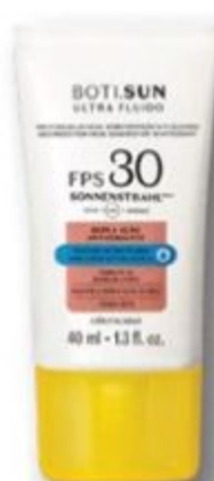
50396 BOTI.SUN PROTETOR SOLAR FACIAL ANTIOXIDANTE ULTRA FLUIDO FPS 30, 40 ml