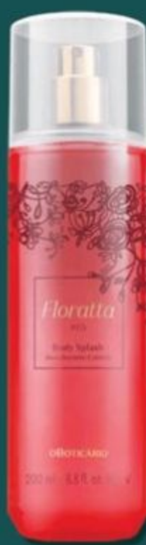
49970 FLORATTA RED DESODORANTE COLÔNIA BODY SPLASH, 200 ml