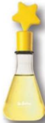
70674 DR. BOTICA COLÔNIA POÇÃO DA AMIZADE, 120 ml