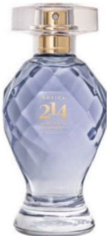
47553 BOTICA 214 VERANO EN FIRENZE EAU DE PARFUM FLORAL FRUTAL, 75 ml