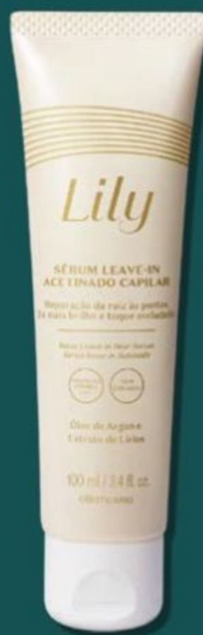
50017 LILY SÉRUM LEAVE-IN ACETINADO CAPILAR, 100 ml

Promoção válida somente para pedidos do ciclo 05/2025 e captação estendida. Para os Revendedores terem direito aos descontos, os produtos deverão constar no mesmo pedido necessariamente. Esta promoção valerá para as unidades que o Revendedor comprar, dentro do ciclo, de acordo com a disponibilidade de estoque do Espaço do Revendedor.