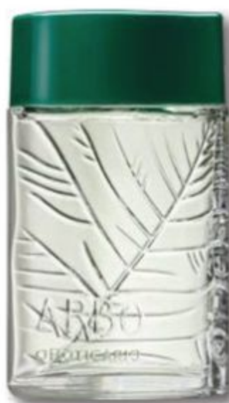
74438 ARBO DESODORANTE COLÔNIA, 100