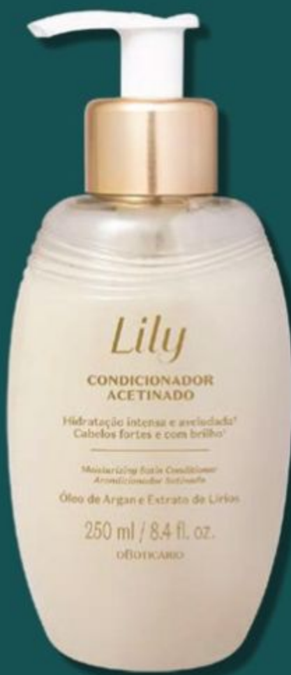
48514 LILY CONDICIONADOR ACETINADO, 250 ml