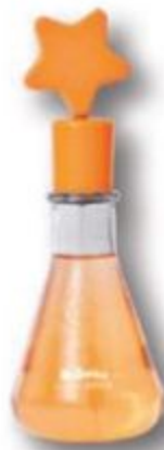
55221 DR. BOTICA COLÔNIA POÇÃO DA CRIATIVIDADE, 120 ml