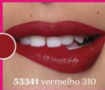
53341 vermelho 310