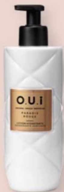
83824 O.U.i LOÇÃO DESODORANTE HIDRATANTE CORPORAL PARADIS ROUGE, 400 ml