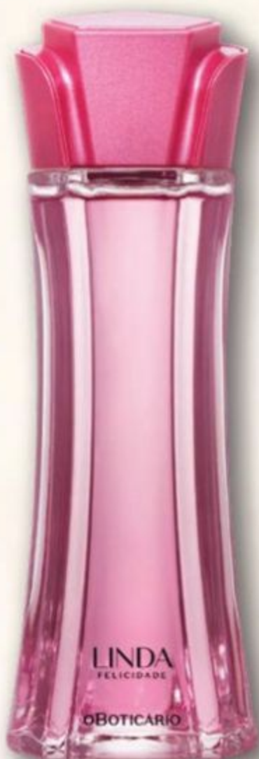
81849 LINDA FELICIDADE DESODORANTE COLÔNIA, 100 ml