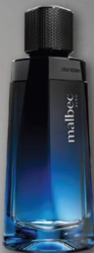
84400 MALBEC BLEU DESODORANTE COLÔNIA, 100 ml