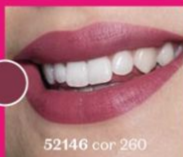
52146 cor 260