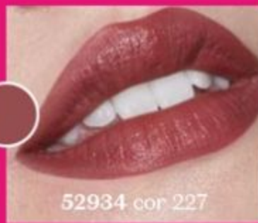
52934 cor 227