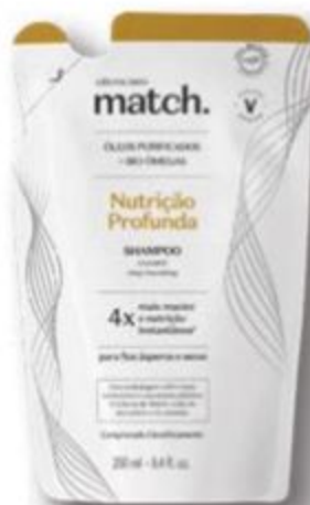
83147 REFIL MATCH SHAMPOO NUTRIÇÃO PROFUNDA, 250 ml