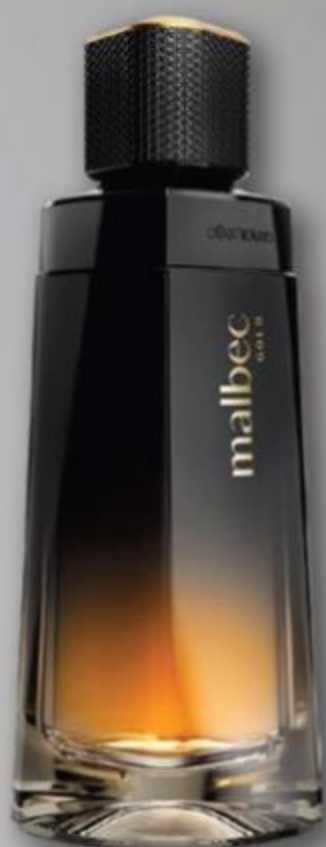
84391 MALBEC GOLD DESODORANTE COLÔNIA, 100 ml