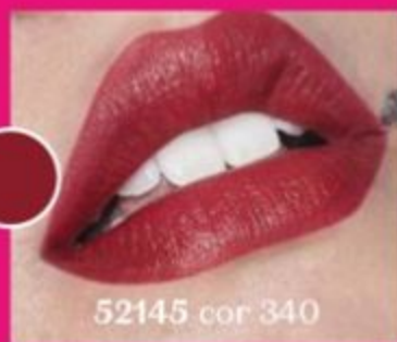
52145 cor 340