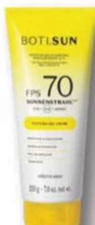
52342 BOTI.SUN PROTETOR SOLAR CORPORAL GEL CREME FPS 70, 200 g