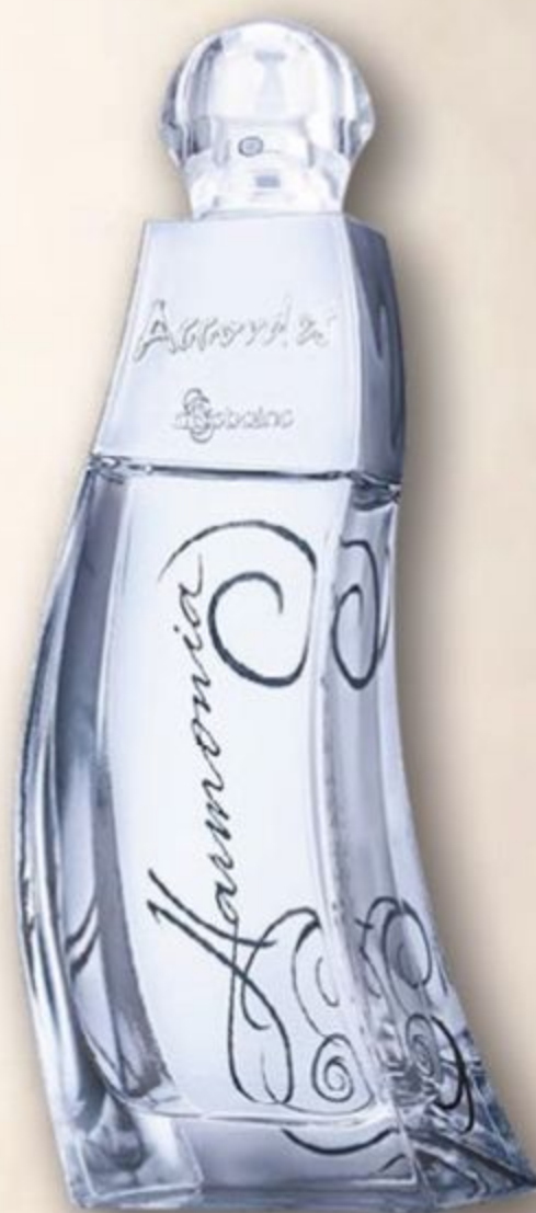
51213 ACCORDES HARMONIA DESODORANTE COLÔNIA, 80 ml