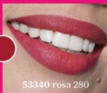
53340 rosa 280