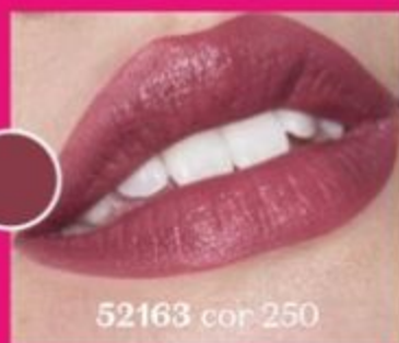
52163 cor 250