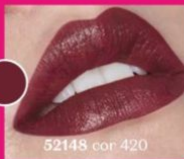
52148 cor 420