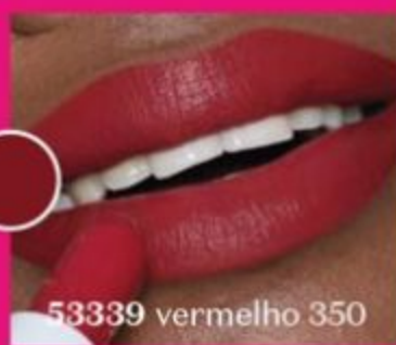
53339 vermelho 350