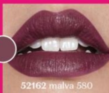
52162 malva 580

Confira mais batons participantes no App ou no Portal do Revendedor