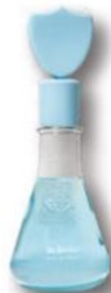
51521 DR. BOTICA COLÔNIA POÇÃO DA CORAGEM, 120 ml