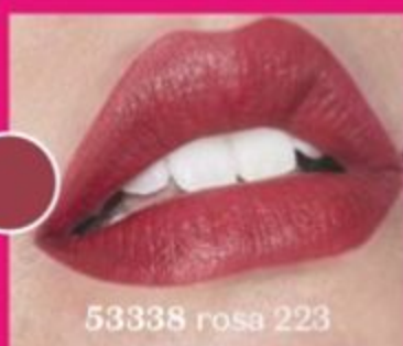
53338 rosa 223