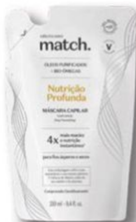
83124 REFIL MATCH MÁSCARA NUTRIÇÃO PROFUNDA, 250 ml