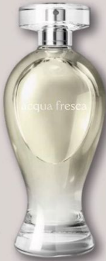
48352 BOTICOLLECTION ACQUA FRESCA DESODORANTE COLÔNIA, 200 ml