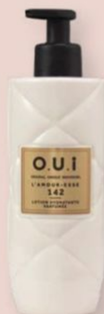
82092 O.U.i LOÇÃO DESODORANTE HIDRATANTE CORPORAL L'AMOUR-ESSE 142, 400 ml