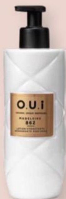
83823 O.U.i LOÇÃO DESODORANTE HIDRATANTE CORPORAL MADELEINE 862, 400 ml