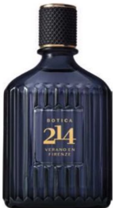
47552 BOTICA 214 VERANO EN FIRENZE EAU DE PARFUM FOUGÈRE AROMÁTICO, 90 ml