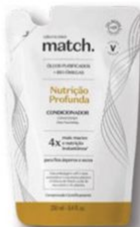
83167 REFIL MATCH CONDICIONADOR NUTRIÇÃO PROFUNDA, 250 ml