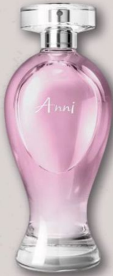
48361 BOTICOLLECTION ANNI DESODORANTE COLÔNIA, 200 ml