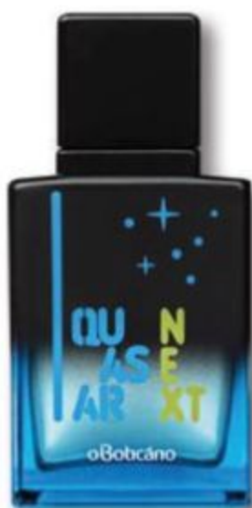
77773 QUASAR NEXT COLÔNIA, 50 ml