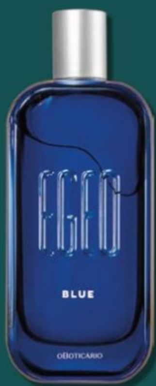
82686 EGEO BLUE DESODORANTE COLÔNIA, 90 ml