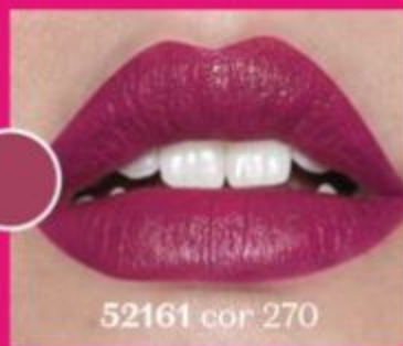
52161 cor 270