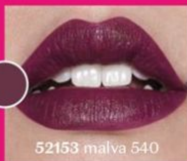
52153 malva 540