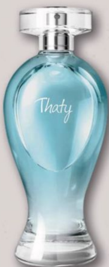
82238 THATY DESODORANTE COLÔNIA, 200 ml

BOTICOLLECTION: AS FRAGRÂNCIAS QUE MARCARAM GERAÇÕES AGORA AJUDAM VOCÊ A POTENCIALIZAR SEUS LUCROS