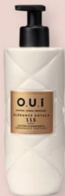
52280 O.U.i LOÇÃO DESODORANTE HIDRATANTE CORPORAL ÉLÉGANCE ROYALE 115, 400 ml

Promoção válida somente para pedidos do ciclo 05/2025 e captação estendida. Para os Revendedores terem direito aos descontos, os produtos deverão constar no mesmo pedido necessariamente. Esta promoção valerá para as unidades que o Revendedor comprar, dentro do ciclo, de acordo com a disponibilidade de estoque do Espaço do Revendedor.