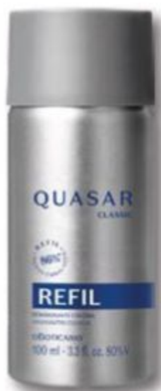
50862 REFIL QUASAR CLASSIC DESODORANTE COLÔNIA, 100 ml