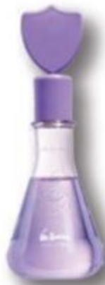
51441 DR. BOTICA COLÔNIA POÇÃO DA FORÇA, 120 ml