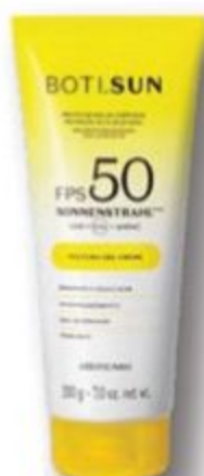
47963 BOTI.SUN PROTETOR SOLAR CORPORAL GEL CREME FPS 50, 200 g