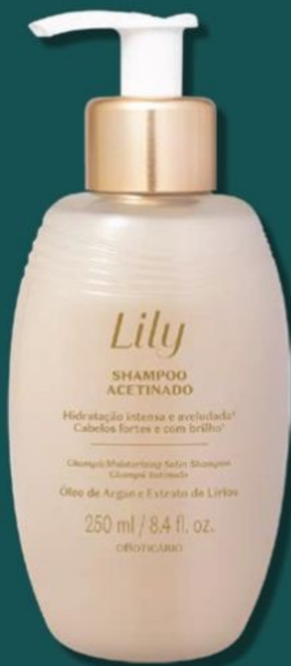
48511 LILY SHAMPOO ACETINADO, 250 ml