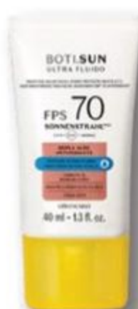
47962 BOTI.SUN PROTETOR SOLAR FACIAL ANTIOXIDANTE ULTRA FLUIDO FPS 70, 40 ml