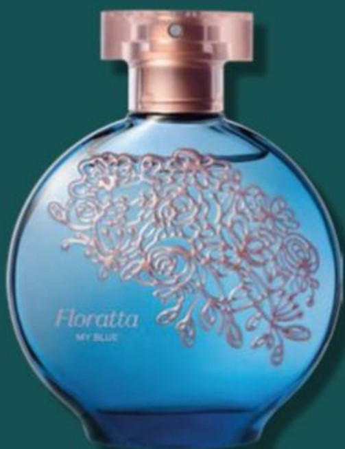
1004 FLORATTA MY BLUE DESODORANTE COLÔNIA, 75 ml