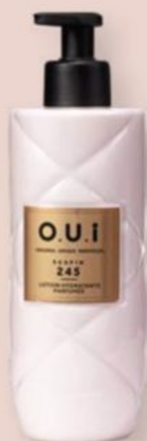
82091 O.U.i LOÇÃO DESODORANTE HIDRATANTE CORPORAL SCAPIN 245, 400 ml