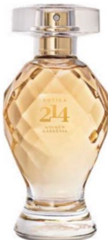
47629 BOTICA 214 GOLDEN GARDÊNIA EAU DE PARFUM, 75 ml