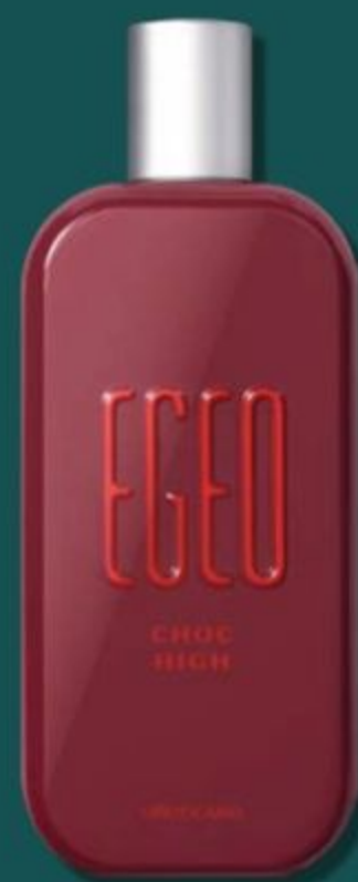
59436 EGEO CHOC DESODORANTE COLÔNIA, 90 ml

Promoção válida somente para pedidos do ciclo 05/2025 e captação estendida. Para os Revendedores terem direito aos descontos, os produtos deverão constar no mesmo pedido necessariamente. Esta promoção valerá para as unidades que o Revendedor comprar, dentro do ciclo, de acordo com a disponibilidade de estoque do Espaço do Revendedor.